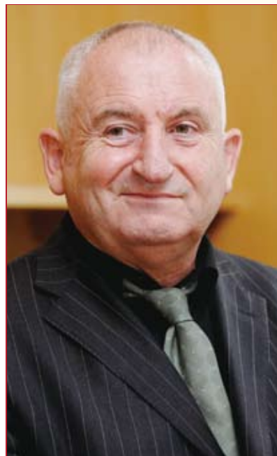
ジョン・バード——John Bird 1946年、ロンドンのスラム街に生まれる。5歳でホームレス状態となり、7歳で養護施設に預けられる。20代後半以降、印刷・出版業を手がけ成功。45歳の時、ザ・ボディショップ会長(当時)のゴードン・ロディックとともにホームレスが販売する雑誌「THE BIG ISSUE」を創刊する。

講演：「貧困と社会的排除に挑戦する世界のストリート・ペーパー」 ジョン・バード氏 発話：「路上で働き、路上を通して社会とつながる」 ビッグイシュー販売者 提案：路上で働くビッグイシュー販売者の「販売の心得」(仮称)発表 対話と議論：ジョン・バード氏、販売者、ボランティア、会場の参加者、スタッフ